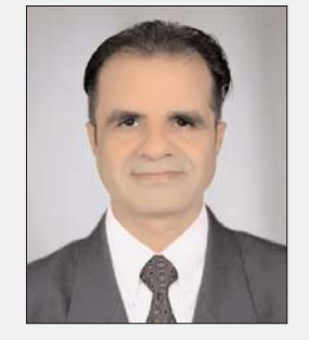
भारत यात्रा टलने के बाद अचानक चीन पहुंचे एलन मस्क - कई सवाल खड़े हुए ?